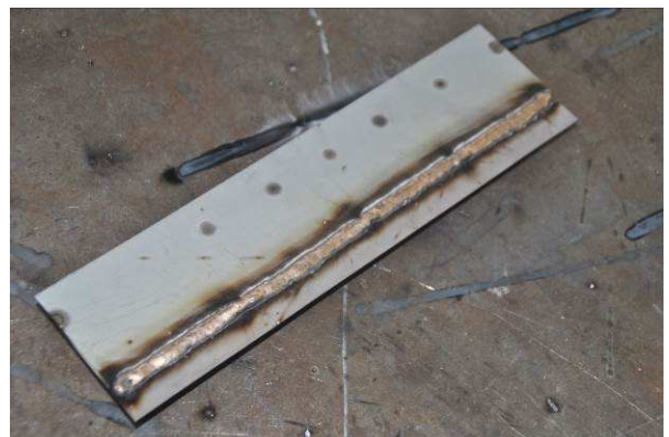
Bild 3 bis 6: Anschließend gibt der Anwendungstechniker Herr Marco Sondorp (ESAB Welding & Cutting GmbH) praktische Hinweise zum Umgang mit modernen Stromquellen zum MSG-Löten. Während der Vorführung erfahren alle mehr über die Anforderungen an die Ausrüstung und an die Nahtvorbereitung.