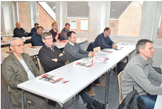
Bild 1: Interessierte Besucher dieser Veranstaltung in den Räumlichkeiten der Handwerkskammer Flensburg.

Bitte beachten Sie, dass Teilnehmer, die mindestens drei Veranstaltungen dieser Vortragsreihe pro Kalenderjahr besuchen, auf Wunsch die Teilnahme-Bescheinigung „DVS-Schweißfachmannfortbildung“ erhalten. (Diese Vortragsreihe ist für DVS-Mitglieder kostenfrei!)