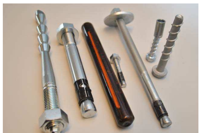
Bild 3 und 4: Die Hauptversagensursachen für Dübel sind Überbeanspruchung, fehlerhafte Montage oder ein unzureichend tragfähiger Untergrund. Daher werden die wichtigsten Punkte bei der Dübelauswahl und -montage anhand von Ausstellungsstücken bei dieser Veranstaltung angesprochen.